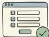
2. Complete Data